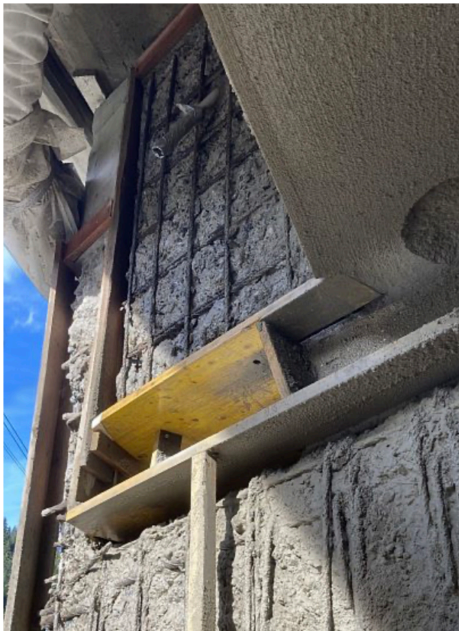
ULTRA AUGSTSPIEDIENA MAZGĀŠANA